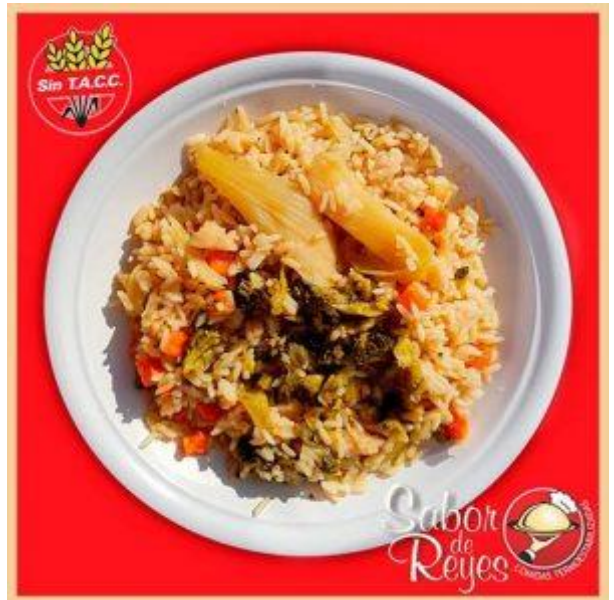
CVL1 Panache de verduras con arros vegano