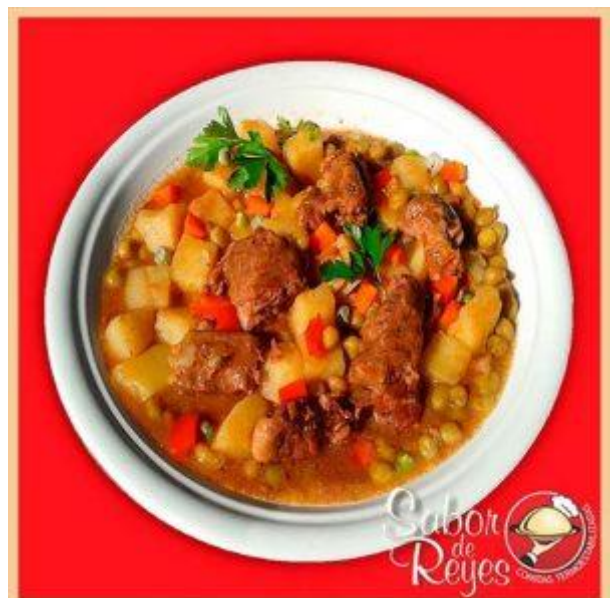
DD4 – CD4 Ternera en Salsa Italiana