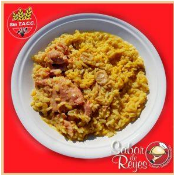
AA1 –CA1 Risoto Italiano