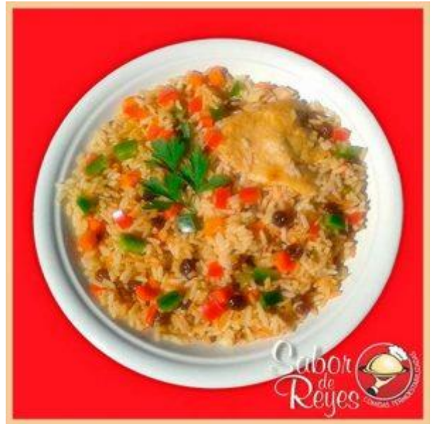
AA2 – CA2 Pollo con arroa a la griega