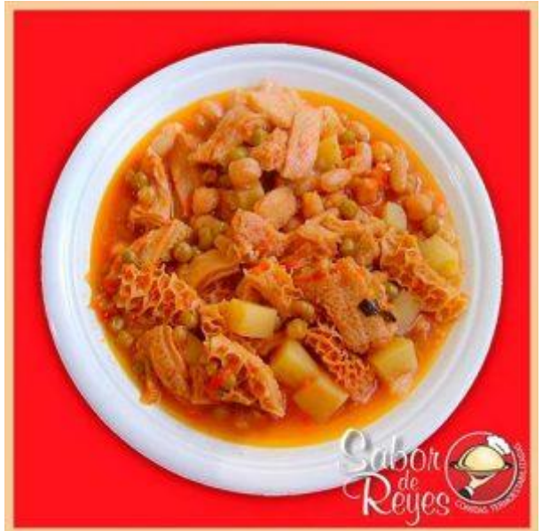
EE2 Callos a la Vizcaina