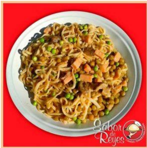
MM1 Tallarines a la Gioia Mia