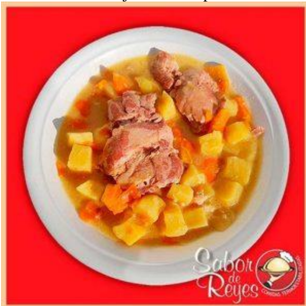
HH1 – CH1 Bondiola de cerdo a la Mostaza