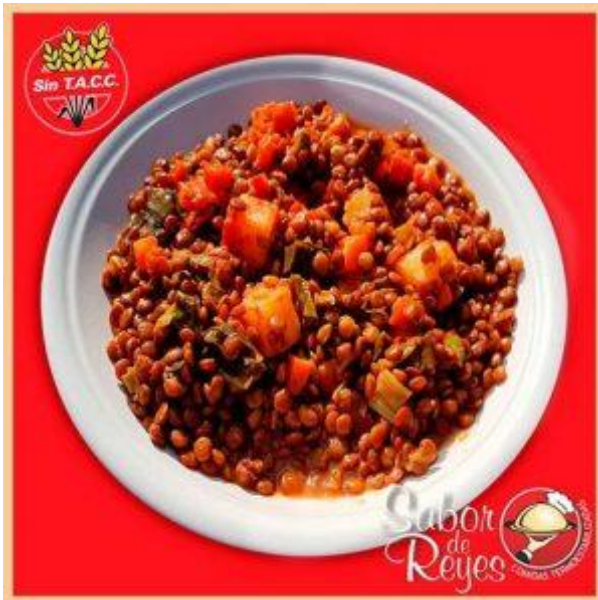
CVE4 Guiso de Lentejones Vegano