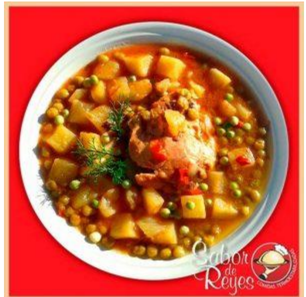
AA4 – CD4 Pollo a la Salsa Italiana