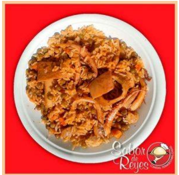
CC2 Cazuela de calamares a la Marplatense