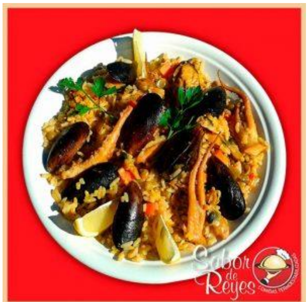
FF1 Paella de Mariscos