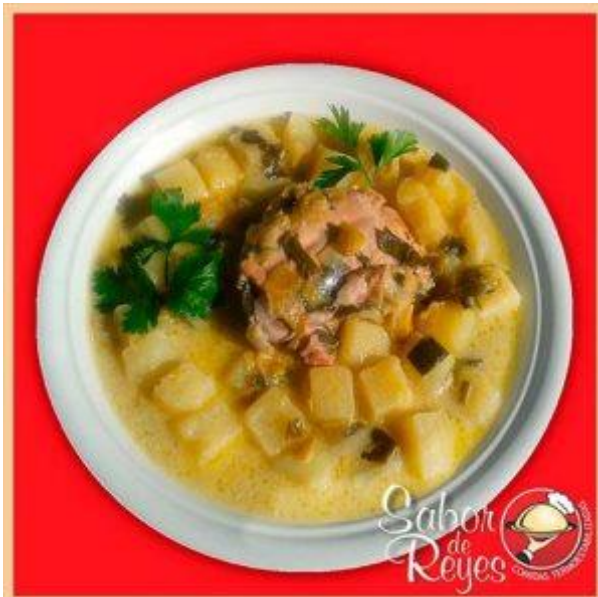
AA3 – CA3 Pollo a la salsa de puerros