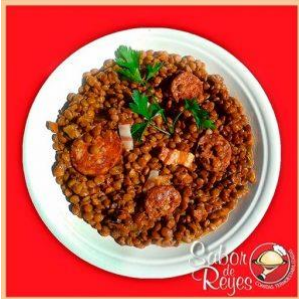
EE1 Lentejones a la española