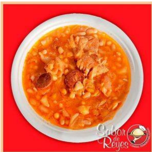
HH4 Caldo Gallego