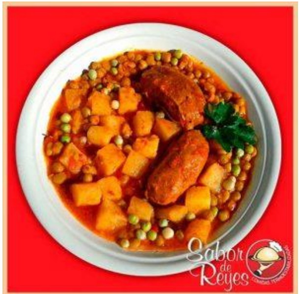
HH3 Chorizos a la Pomarola